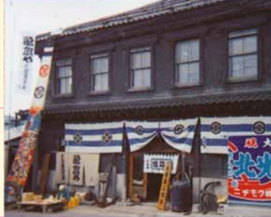
NPO北海道職人義塾大学校・本校