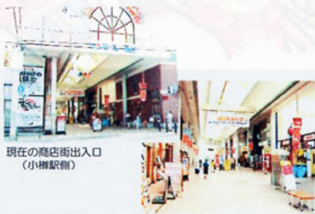
現在の商店街出入口 (小樽駅側)