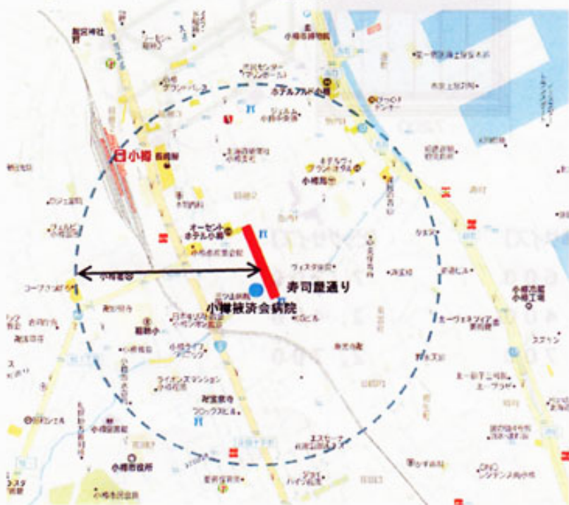
平成 27 年 9 月商店街周辺通行量（1 日平均）