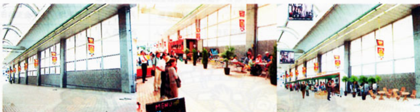
店舗設置予定場所