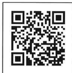
ご案内特設ページ