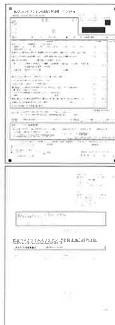
「接種券が印字された予診票」